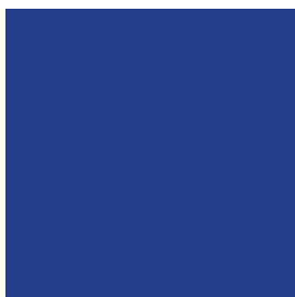
PANTONE BLUE 072 C