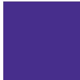
PANTONE MEDIUM PURPLE C