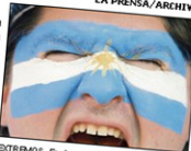
EXTREMOS. En Argentina, la pasión por el fútbol va más allá del deporte y ha causado muertos.