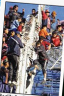
"Reality Goal" pretende erradicar la violencia.

Además, si "Reality Goal" tiene buena repercusión, su creador se plantea también presentar el formato a las ligas mundiales de fútbol.