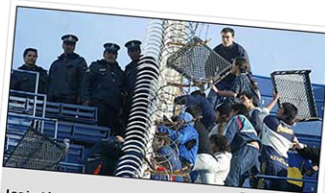
Los incidentes se suceden casi todas las semanas

"La idea es darle al fútbol argentino un mensaje de no violencia, demostrando como los fanáticos pueden vivir todo el folclore futbolero, pero sin agresiones", dijo Oleberg, quien fue recientemente reconocido por la Organización Mundial de la Paz por su iniciativa.