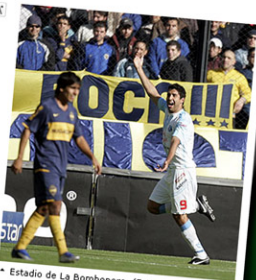
Estado de La Bombonera.

El programa contará con diez hombres e igual número de mujeres hinchas de los diez principales